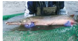
アリゲーターガー