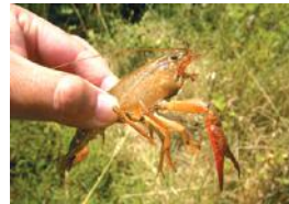
アメリカザリガニ